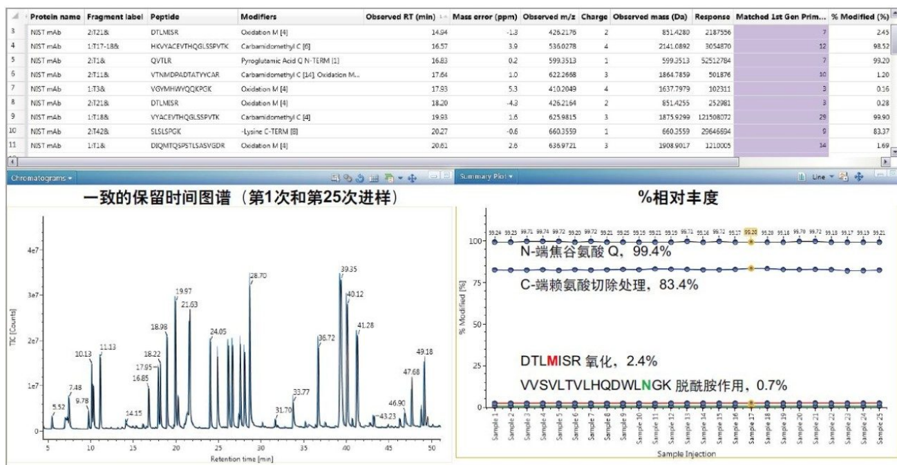
图4. BioAccord系统的肽图分析工作流程可提供PTM鉴定功能。图中所示为自动数据处理后的查看面板。组分表包含：序列信息、 m/z 和中性质量数、质量数偏差、%相对丰度以及每个肽的碎片信息。汇总表提供了所有样品中选定肽修饰的简图。面板左下角使用第1次进样和第25次进样的TIC展示了保留时间的一致性。